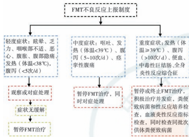
图2 菌群移植(FMT)不良反应处理流程图

8. 极重度症状如并发生命体征异常者,立即终止FMT治疗,同时针对靶器官治疗(1C)